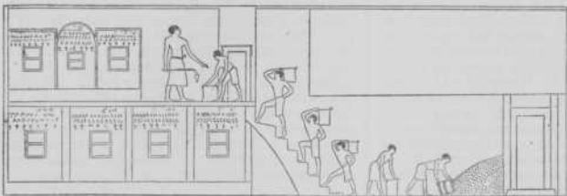
Het wannen en opslaan aan koren bij de Egyptenaen.

bloedigen verdelgungskrijg (2 Kon. 13 : 7; Spreuk. 20 : 26; Jes. 41 : 2, 15; Amos 1 : 3), wellicht om de gelijkheid met de in den krijg gebezigde (2 Sam. 12 : 31) sikkewagens. De dorschende os mocht men niet muilbanden, gelijk men dan ook op de oude Egyptische monumenten geen muilband aan dorschende ossen vindt (Deut. 25 : 4; 1 Cor. 9 : 9; 1 Tim. 5 : 18). Gedurende het dorschen werd het koren meermalen door een gaffel omgekeerd. De aren, die met het gehakte stroo waren vermengd, en welke in het midden van den kring opgehoopt lagen, werden van het stroo gezuiverd door een wan (Ruth. 3 : 2), gewoonlijk des avonds, wanneer er meestal een koeltje begon te waaien (Jer. 4 : 11; 51 : 1 vv.). Dit koeltje dreef dan het kaf van de hooger gelegen dorschvloeren af. — Vaak als beeld gebezigd van het gericht (Ps. 1 : 4; 35 : 5; 83 : 14; Job 21 : 18; Jes. 17 : 17; 29 : 5; 40 : 24; 57 : 13; Jer. 4 : 11; 13 : 24; 51 : 2; Dan. 2 : 35; Hosea 13 : 3; Zef. 2 : 2). Soms werd ook wel het kaf of met vuur verbrand op het veld (Gen. 15 : 7), of als voeder gebezigd (Gen. 24 : 25; Jes. 11 : 7; 65 : 25). Het wannen geschiedde: 1. door met een vork de aren, die met haksel vermengd waren, tegen den wind in, in de hoogte te werpen, zoodat het koren op den grond